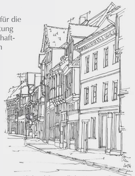
Blick auf die nördliche Häuserzeile des Steinwegs

Ziel des Blockkonzeptes ist es, zukunftsfähige Ansätze und Ideen für die gesamte Stadt aufzuzeigen. Grundidee der Planung ist die Einrichtung eines Quartierinnengartens mit zentralem Gewässer als gemeinschaftliche Grünanlage. Dabei werden Anlagen zur Energiegewinnung in wirtschaftlichen Größenordnungen ebenso integriert wie anspruchsvoll gestaltete Parkmöglichkeiten für PKW. Ein Bestandteil der Erarbeitung war die Bürgerbeteiligung. Methoden wurden erprobt, die auch bei der Erstellung von weiteren Blockkonzepten genutzt werden sollen. Um das Ergebnis einer breiten Öffentlichkeit zugänglich zu machen, wurde eine Wanderausstellung konzipiert, die erstmals bis 4. Juli 2014 im Kulturzentrum Reichenstraße besichtigt werden kann. Weitere Informationen und Termine sind im Weblog unter qlbblock.wordpress.com zu finden.