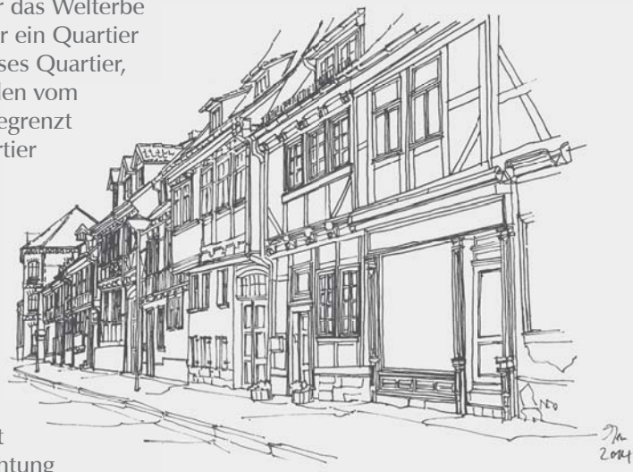
Blick auf die östliche Häuserzeile der Reichenstraße

Den Belangen von Klimaschutz und Nachhaltigkeit wurden bei diesem Blockkonzept besondere Beachtung geschenkt. Wie sind diese lebensnotwendigen Belange mit der reich überkommenen Vergangenheit in Einklang zu bringen?