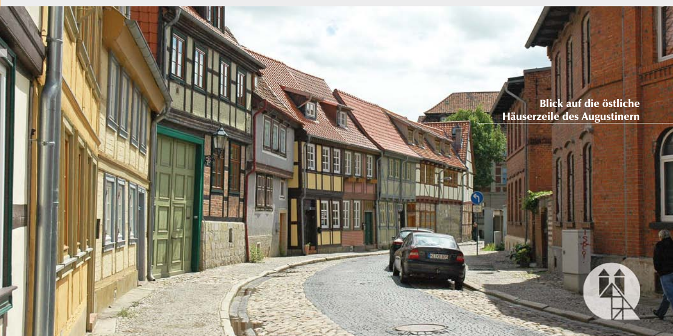
Blick auf die östliche Häuserzeile des Augustinern