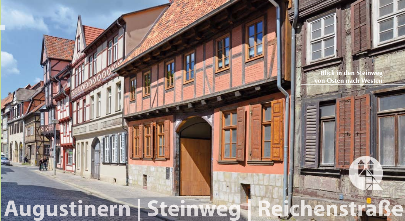
Blick in den Steinweg von Osten nach Westen